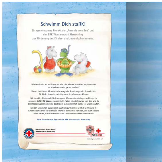
Seite im Buch